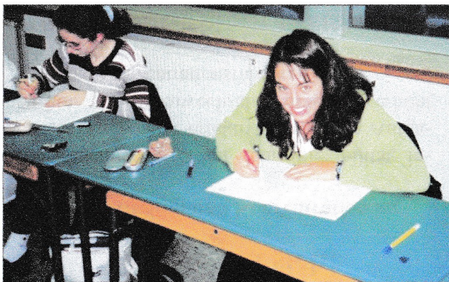
Schülerinnen bei der Sprachzertifizierung in Saarbrücken

An den Sprachkursen nahmen im Schuljahr 2019/20 mehr als 500 Schüler/innen teil.