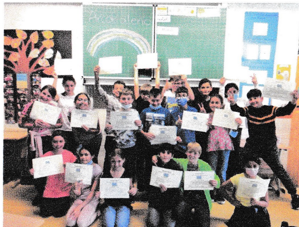
Klasse 4 der GS Bous nach der Zertifikatsprüfung CILS der Universität von Siena im Juni 2021

Worauf ist diese Beliebtheit der italienischen Sprache zurückzuführen? Italienisch wird nicht nur aus persönlichem Interesse, sondern auch aus beruflichen Gründen gelernt. Schließlich genießen einige Sektoren der italienischen Wirtschaft ein besonderes Prestige: Man denke an die Mode, den Design, die Gastronomie, den Tourismus sowie an einige Technologiebranchen.